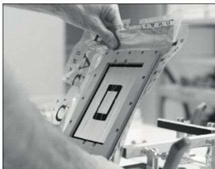
Filigran: Die hauchzarten Folienmembranen entstehen Stück für Stück in hochpräziser Handarbeit

Die zweite typische Piëga-Zutat sind Hochtוןchassis, in denen statt konventioneller filigrane Folienmembranen arbeiten. Piëga bezeichnet sie als Bändchen, manche Experten nennen sie lieber Magnetostaten. Jedenfalls: Die typischen Piëga-Hochtöner erzeugen den Schall mit einer hauchdünnen Folie, auf der eine noch zartere, mäandernde Flachspule aus Aluminium klebt. Dahinter sitzen extrem starke Stabmagneten aus Neodymium. Der Vorteil gegenüber einer konventionellen Kalottenmembran: Die dünne Folie vibriert fast schwerelos; die Datenblätter nennen eine bewegte Masse von nur 7 Milligramm. So kann der Membran den Signalen außergewöhnlich schnell und präzise folgen. Die Herstellung solcher Chassis ist allerdings