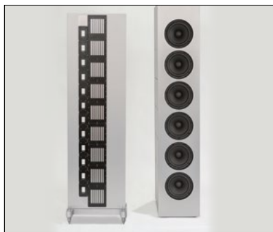
Beeindruckend in Klang und Gestalt: Super-Lautsprecher Master Line Source mit separater Bass-Einheit