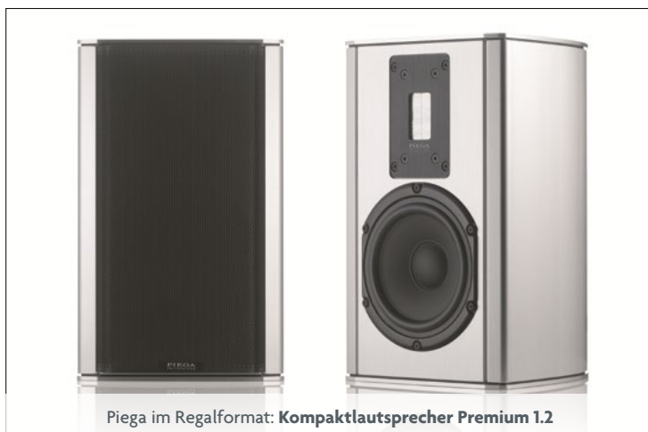
Piëga im Regalformat: Kompaktlautsprecher Premium 1.2