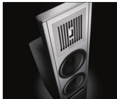
Strahlt bipolar nach vorn und hinten: Koaxiales Mittel-Hochtון-Chassis im Lautsprecher Master On

Edle Uhren, köstliche Schokolade, prächtiger Käse – was aus der Schweiz kommt, lässt die Herzen von Genussmenschen in aller Welt höher schlagen. Seit einer Generation gehören auch feine Lautsprecher dazu: Piëga , eine Manufaktur in Horgen am Südufer des Zürichsees, erfreut mit seinen exquisiten Schallwandlern anspruchsvolle Musikhörer auch weit außerhalb der helvetischen Landesgrenzen. Von Wolfgang Tunze